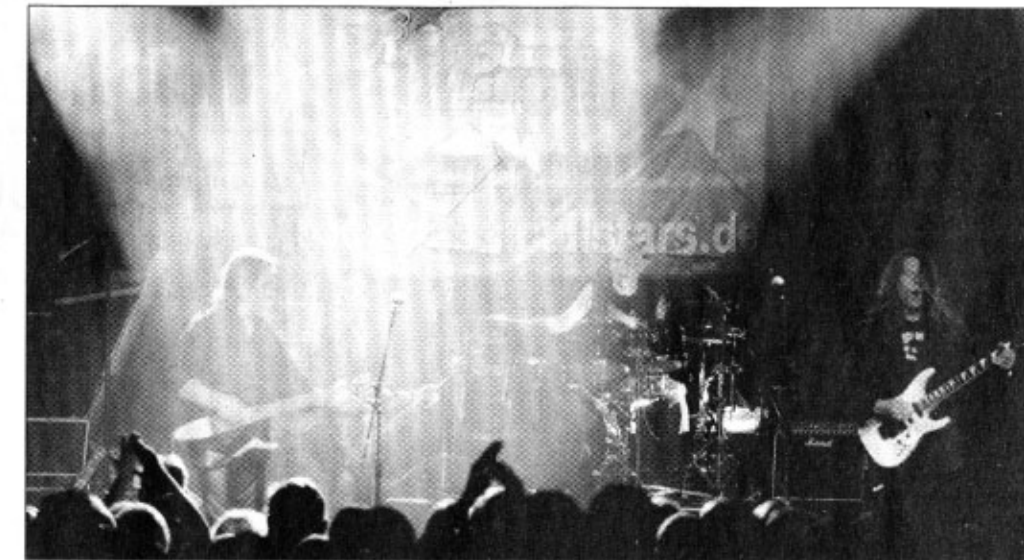
Keine Cover-Versionen, alles original: Die Allstars geben sich am 7. Februar an der Hellbachstraße das Mikro in die Hand.

Mit ihrer Band, allesamt Profimusiker, können die Stars aber auch anders. „Wir spielen auch Rammstein“, sagt der Organisator. Was 2003 mit einem Benefizkonzert in der Bochumer Zeche begann, hat sich längst zu einem weltweiten Renner mit gut 120 Auftritten im Jahr ent-