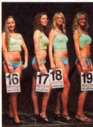
Gruppenbild mit Damen: Wer ist die Schönste im Land?